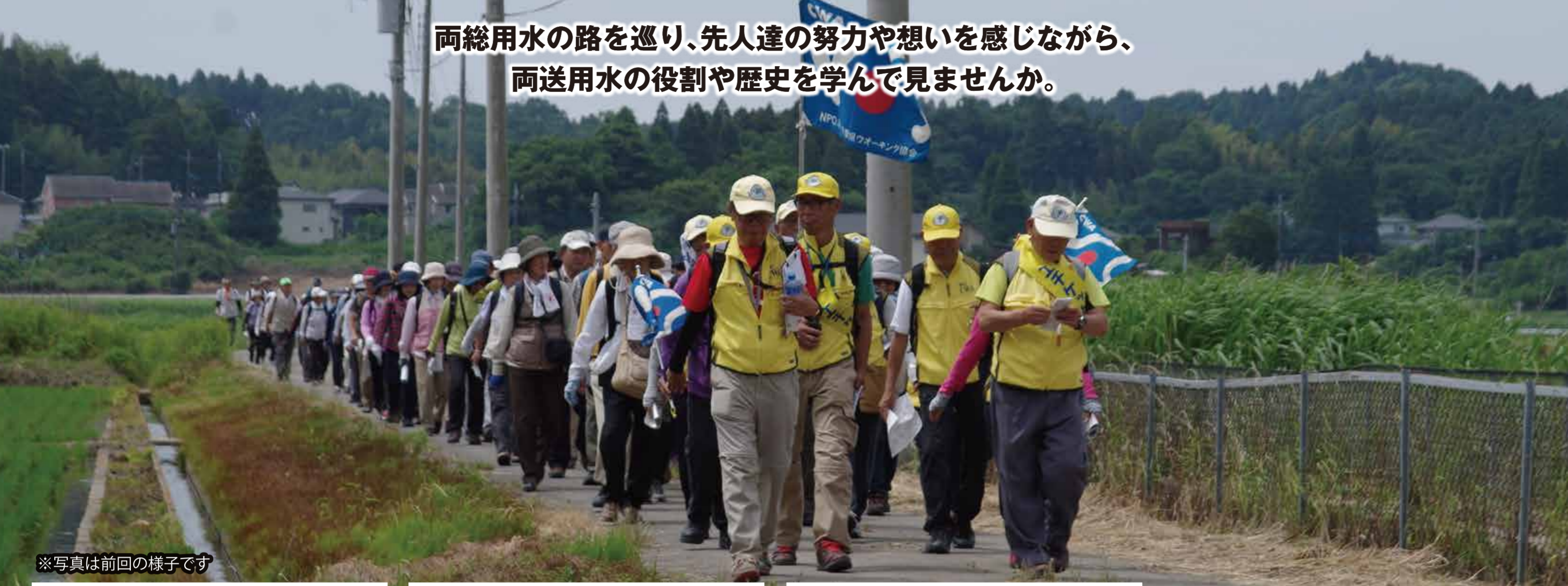
※写真は前回の様子です

両総用水の路を巡り、先人達の努力や想いを感じながら、 両送用水の役割や歴史を学んで見ませんか。