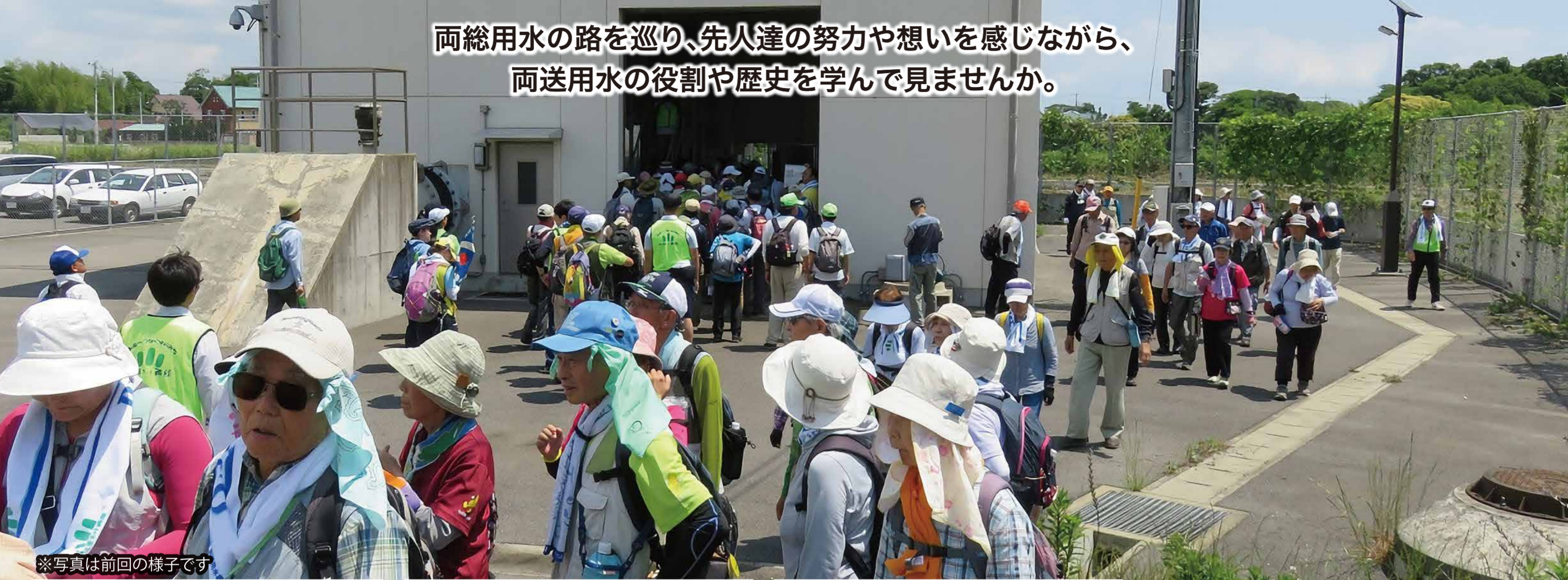
※写真は前回の様子です

両総用水の路を巡り、先人達の努力や想いを感じながら、 両送用水の役割や歴史を学んで見ませんか。