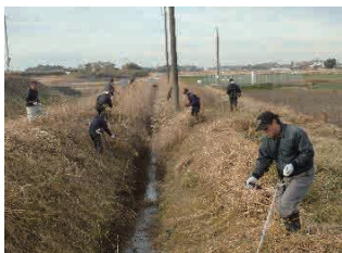
横芝光町 北清水地区