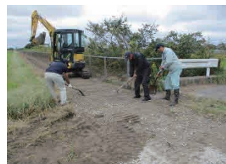
横芝光町 鳥喰上地区