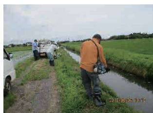
横芝光町 鳥喰沼地区