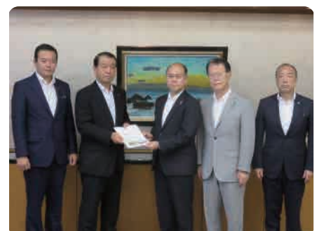
滝川千葉県副知事