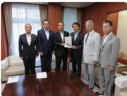
齋藤農林水産大臣