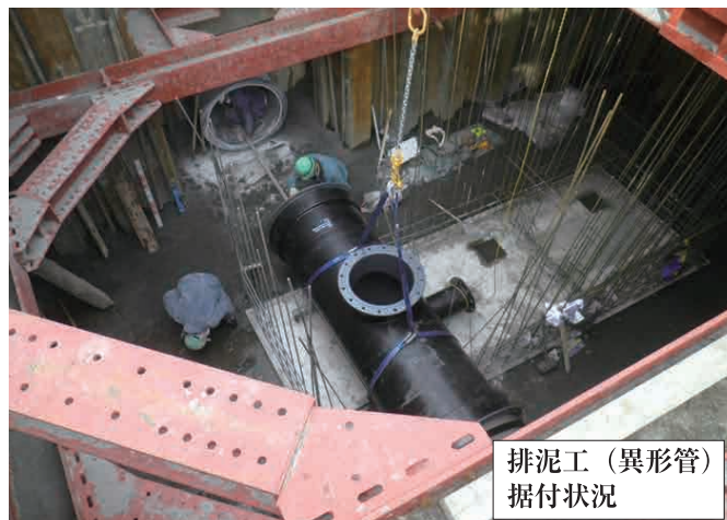
排泥工 (異形管) 据付状況