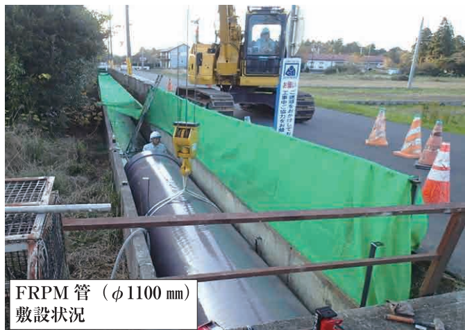
FRPM 管 (φ1100mm) 敷設状況