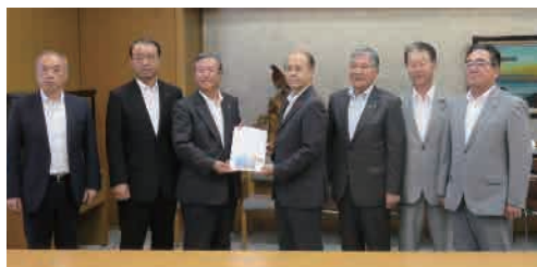
千葉県(滝川副知事)