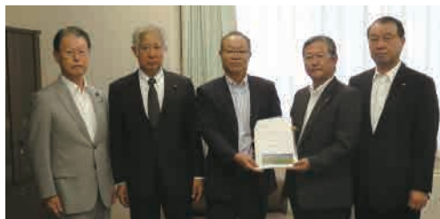
農林水産省 農村振興局(室本農村振興局次長)