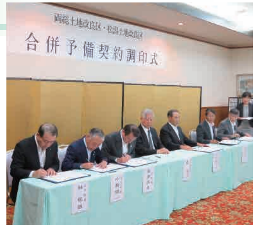
合併予備契約書に署名、押印し、立合者の署名をいただきました。

今後も、これまでと変わらない組合員サービスに努めて参りますので、皆様のご理解・ご協力をお願いいたします。