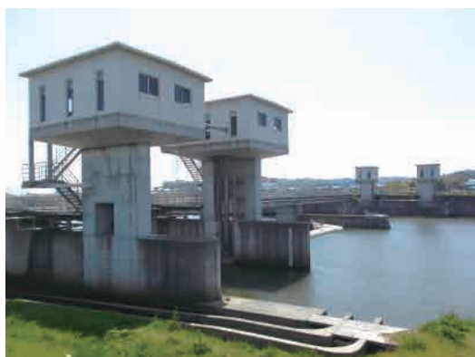
松潟堰(長生郡長生村)