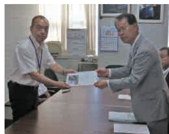
千葉県農林水産部 (井上農林水産部次長)