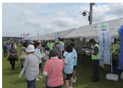
多古町(平成28年6月12日) あじさい祭り

また、両総用水の路を巡るウォーキング大会なども開催し、両総用水をPRしています。