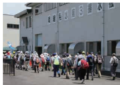
東金市・山武市(平成28年6月4日) 両総用水の路ウォーク