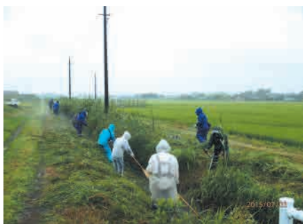
横芝光町 北清水地区