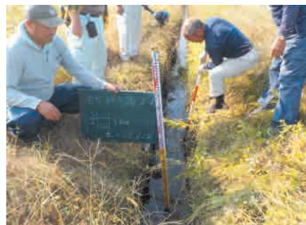
大網白里市 南今泉・北今泉・四天木地区