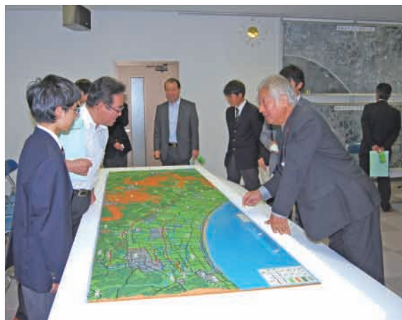
ジオラマを囲んで生徒との意見交換