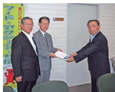
千葉県 麻生農林水産部長へ