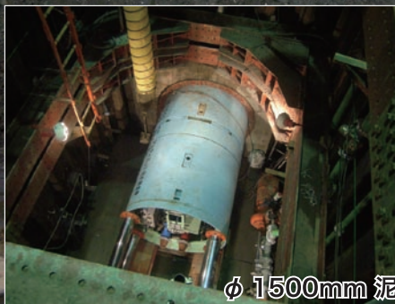
φ 1500mm 泥水掘進機 (発進抗内部)