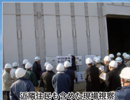
近隣住民も含めた現場視察