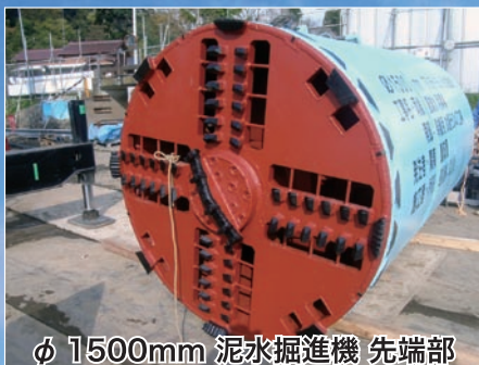
φ 1500mm 泥水掘進機 先端部