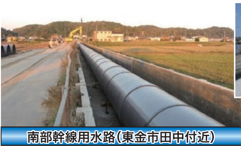
南部幹線用水路(東金市田中付近)