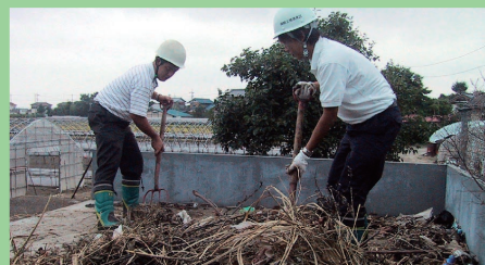
不法投棄されたゴミ