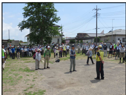
《出発式(横芝駅東側の広場)》

今回の『第8回 両総用水の路ウォーク《横芝光》』ですが、水資源機構千葉用水総合管理所の他に横芝光町・千葉県山武農業事務所・山武農林業振興普及協議会・NPO法人美しい田園21の各関係機関に後援及び協力をいただき、開催することができました。