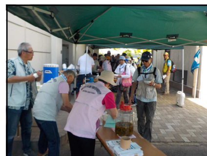
《昼食会場(第2揚水機場)》