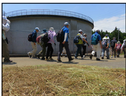
《第2揚水機場 吐水槽》