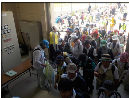
《山武東部支線機場》