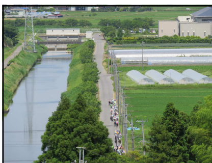
《第2揚水機場 導水路》